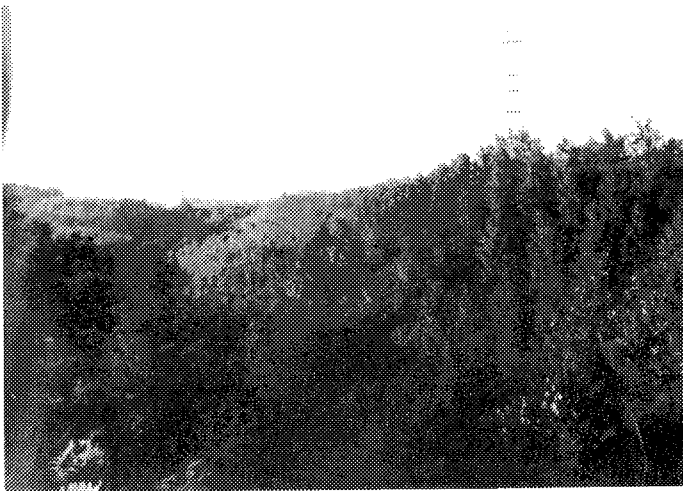
Sl. 2. Izgled kose površine deponije pepela posle rekultivacije. Fig.2. Inclined ash deposit after recultivation.