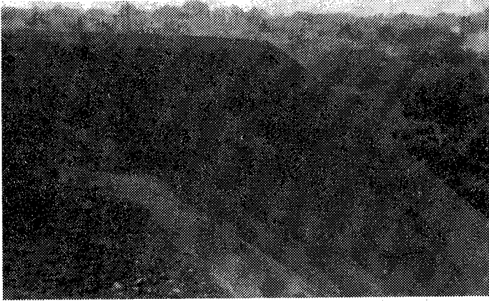
Sl. 1. Izgled kose površine deponije pepela pre rekultivacije. Fig.1. Inclined ash deposit before recultivation.